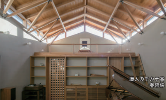
職人のチカラ賞 奏楽棟