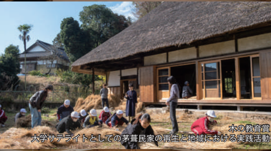
木の教育賞 大学サテライトとしての茅草民家の再生と地域における実践活動