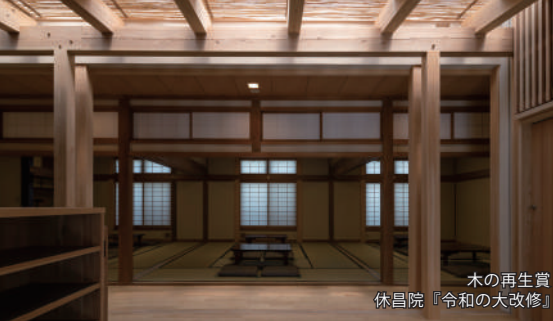
木の再生賞 休昌院『令和の大改修』