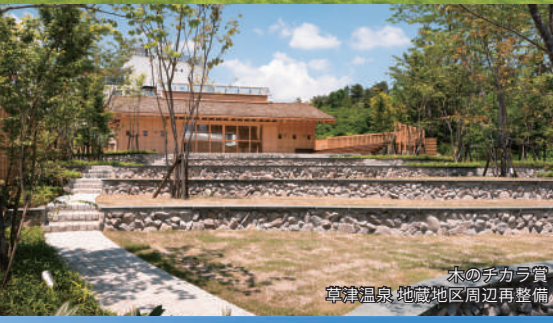
木のチカラ賞 草津温泉 地蔵地区周辺再整備