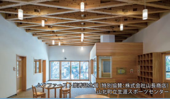
ムクファースト崇徳記念賞(特別協賛:株式会社山長商店) 山北町立生涯スポーツセンター