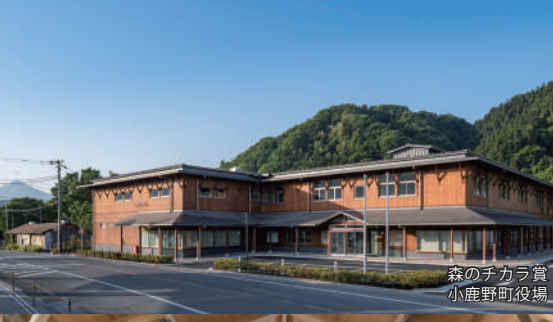
森のチカラ賞 小鹿野町役場